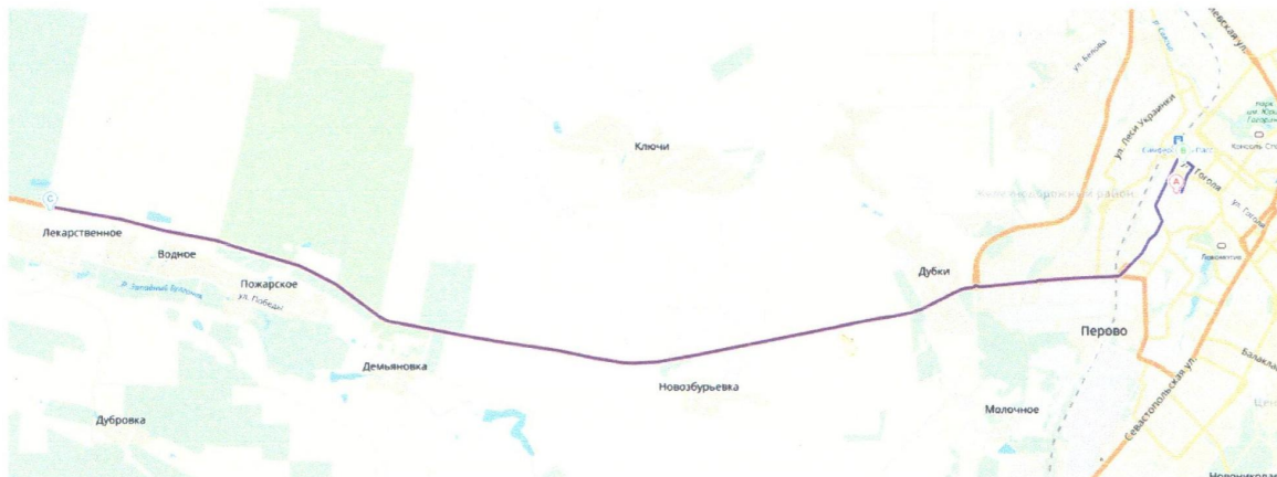
Схема маршрута №1