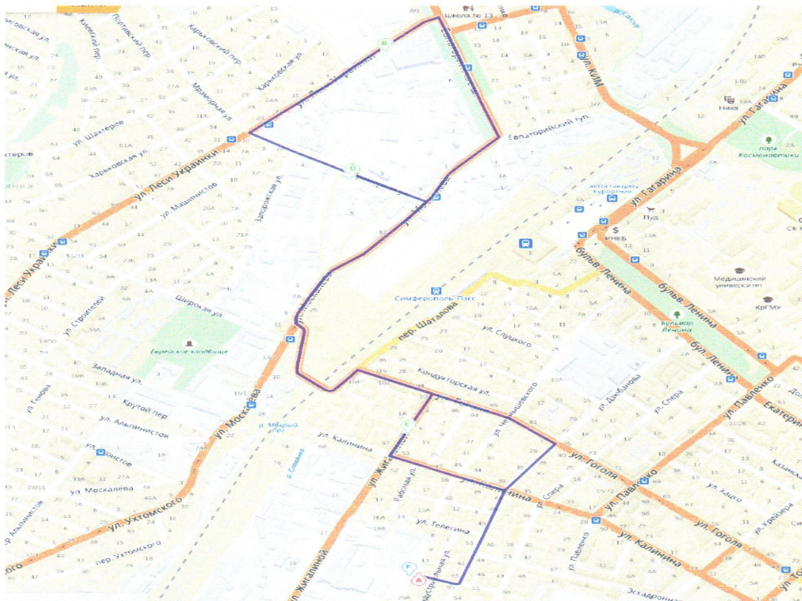
Схема маршрута №3